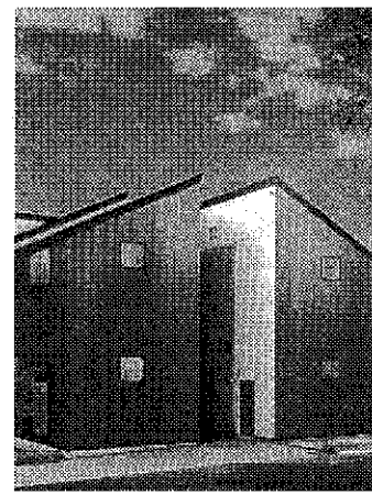
▲売れ筋は6000万円前後

（東京都渋谷区）では木造建築など地震に対する危機感が売りに物件に制震装置を標準設置として制震装置を設置し、他社との差別化を行っている。図った。設置すれば在来